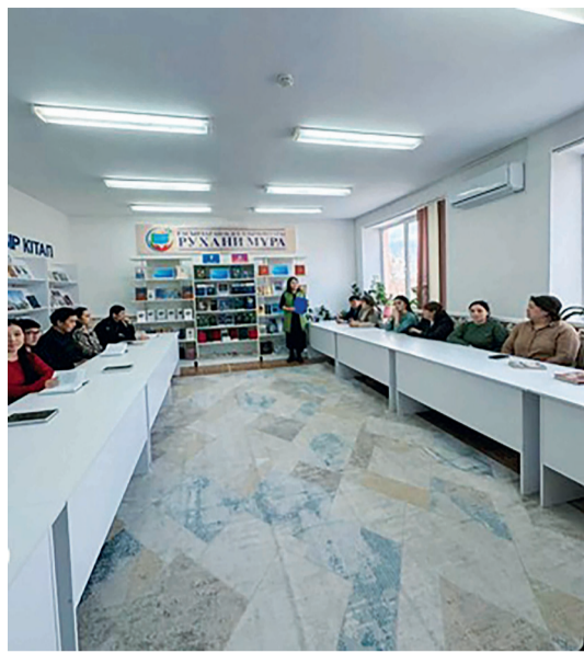
Ж.Жабаев ақын туғанына 180 жыл

Жамбыл Жабаев – халық жадындағы ұлы тұлға. Қазақ халқының поэзия әлемінде айрықша орны бар, жыр дүлдүлі