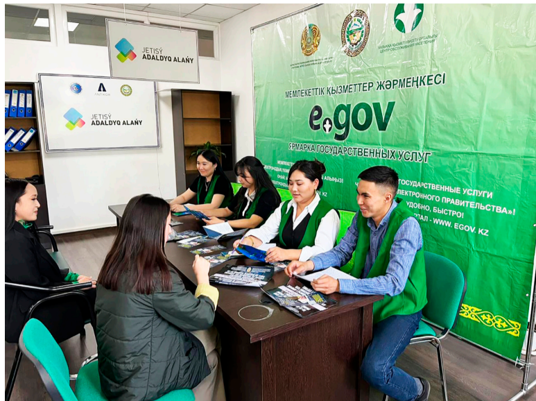
Ауданда жыл басынан бері көрсету орталығында және халық көп жиналатын орын-ауданның сервистік әкімдігінде) дарда (халыққа қызмет Мемлекеттік органдардың

жұмыспен қамту және әлеуметтік бағдарламалар бөлімінің, ауыл шаруашылығы және жер қатынастары бөлімінің, экономика және қаржы бөлімінің, тұрғын үй коммуналдық шаруашылық, тұрғын үй коммуналдық шаруашылық бөлімінің қатысуымен 7 мемлекеттік қызмет жәрмөнкесі өткізілді жолаушылар көлігі және автомобиль жолдары, құрылыс, сәулет және қала құрылысы бөлімі, ішкі саясат, мәдениет, тілдерді дамыту және спорт бөлімі, аталған жәрмөнкелердің кіреберісінде 440 тұрғын қабылданып, көрсетілетін қызметті алушылардың құқықтарын түсіндіру бойынша 760 материал таратылды.