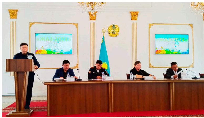
2024 жылдың 04 мамырында Ескелді ауданы әкімінің орын-