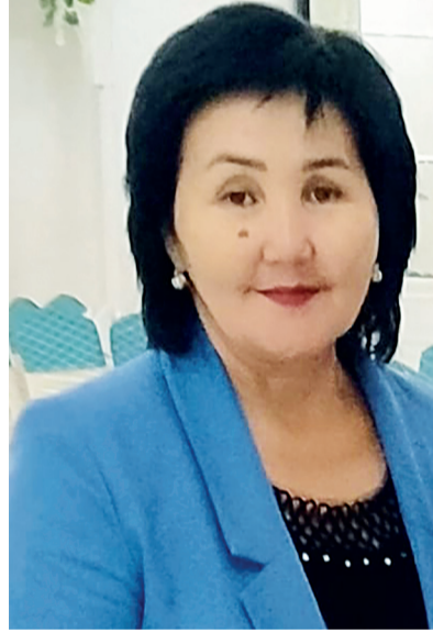
«Сабақ беру — үйреншікті жай ғана шеберлік емес, ол — жаңадан жаңаны табатын өнер» Жүсіпбек Аймауытов

Функционалдық сауаттылығы дегеніміз - адамдардың әлеуметтік, мәдени, саяси және экономикалық қызметтерге белсене араласуы, яғни бүгінгі жаһандану дәуіріндегі заман ағымына, жасына қарамай ілесіп отыруы, адамның мамандығына, жасына қарамай үнемі білімін жетілдіріп отыруы. Ондағы басты мақсат жалпы білім беретін мектептерде Қазақстан Республикасының зияткерлік, дене және рухани тұрғысынан дамыған азаматын қалыптастыру, оның әлемде әлеуметтік бейімделуі болып табылады. Қоғамның дамуына байланысты сауаттылық ұғымының мәні тарихи тұрғыдан өзгергенін, тұлғаға қойылатын талаптарда оқу, жазу, санай білу қабілеттерінен гөрі белгілі бір қоғамда өмір сүруге қажетті білім мен біліктердің жиынтығын игеру, яғни функционалдық сауаттылыққа жету.