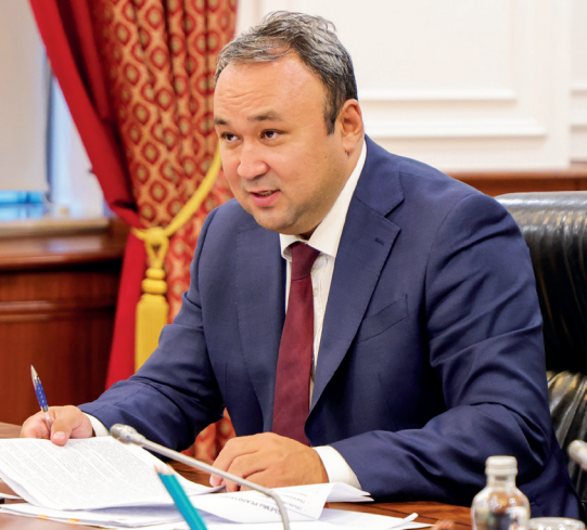
Үкіметте ҚР Премьер-Министрі Әлихан Смайыловтың төрағалығымен өткен кеңесте

Ішкі нарықтың қажеттілігін т о л ы қ қамтамасыз ету үшін сұйытылған мұнай газын өндіруді ұлғайту ш а р а л а р ы қаралды. Ж и ы н д а еліміздегі газ тұтынудың жыл сайын артып келе жатқаны, атап айтқанда, өткен жылдың қорытындысына сәйкес бұл көрсеткіш 1,8 млн тоннаны құрағаны айтылды. кәсіпорындарына, халықтың қажеттіліктеріне және басқа да салаларға жұмсалды. 2023 жылғы болжамды газ тұтыну көлемі 1,9 млн тоннаны құрайды. Артып келе жатқан қажеттіліктерді өтеу үшін бірқатар келешегі бар жаңа кен орындары игеріле бастайды. Олардан алғашқы өндірілген газды осы жылдың соңына дейін алу жоспарланып отыр. Премьер-Министр жанар-жағармай нарығындағы жағдайды ұдайы бақылаудың және азаматтарды, өнеркәсіп кәсіпорындары мен әлеуметтік мекемелерді үздіксіз қамтамасыз ету үшін жоспарланған жобаларды уақтылы іске асырудың маңызды екенін атап өтті. 10%-ы халықтың қажеттіліктеріне және басқа да салаларға жұмсалды. 2023 жылғы болжамды газ тұтыну көлемі 1,9 млн тоннаны құрайды. Бұл көлемнің 65%-ға жуығы автокөліктерге, 25%-ы өнеркәсіп