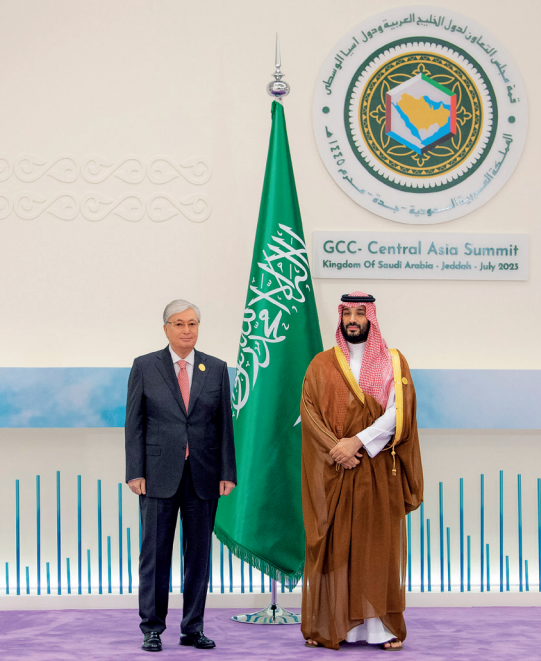
Президент өз сөзінде Орталық Азия мен Шығанақтағы араб мемлекеттері басшыларының бүгінгі кездесуі, ең алдымен, уақыт талабы және көпжақты ынтымақтастықты мүлде жаңа деңгейге көтеру жолында өзара түсіністік бар екенін көрсететініне назар аударды. Оның айтуынша, біздің елдеріміз екіжақты форматта берік әрі үйлесімді мемлекетаралық қатынас орнатты. Сенімді әрі белсенді саяси диалог, сауда-экономикалық ынтымақтастық дамып, мәдени-гуманитарлық байланыстарды тұрақты түрде нығайтып келеді.

– Жаһандық орнықты даму мәселесі бойынша мемлекеттеріміздің халықаралық аренадағы көзқарастары – орталық немесе тауқы. Жалпы, қауіпсіздік пен тұрақтылықты қамтамасыз ету жөніндегі мақсаттары да бір. Тарихи байланыстар, ортақ рухани құндылықтар, достық пен бауырластық – қарым-қатынасымыздың берік негізі екені сөзсіз. Қазақстан бүгінгі кездесуге ерекше мән береді. Шығанақ елдерінің саяси ықпалы, экономикалық және инвестициялық әлеуеті зор. Олар – көптеген негізгі бағыттар бойынша біздің ең маңызды серіктесіміз. Орталық Азия мемлекеттерінің ішкі аймақтық ынтымақтастығын жандандырып, өңірдің жаһандық маңыздылығын күшейту қажет деп санаймыз. Бұл көпжақты ықпалдестікті тереңдету үшін жаңа мүмкіндіктерге жол ашады. Осы іске «Орталық Азия +» диалог форматы елеулі үлес қосатыны сөзсіз, – деді Қасым-Жомарт Тоқаев.