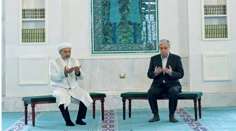
Президент Қасым-Жомарт Тоқаев елордадағы Әзірет Сұлтан мешітіне барып, Қазақстан Құрбан айт мерекесімен құттықтады. Сонымен қатар Мемлекет басшысының атынан құрбандық шалынды