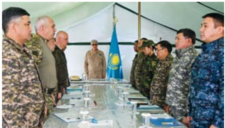
Президент Қасым-Жомарт Тоқаев Абай облысындағы алапат өртке байланысты Төтенше жағдайлар жөніндегі жедел штабтың отырысын өткізді.

Жиынға қатысушылар, ең алдымен, табиғат апаты кезінде қаза тапқан азаматтарды бір минут үнсіздікпен еске алды.