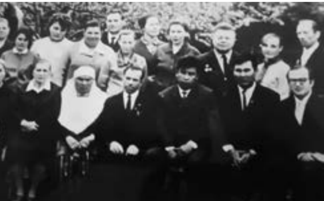
Ұлбала апа Украина. Мектеп ұжымымен

Матай Байысовқа 1944 жылы 10 қаңтарда СССР Жоғарғы Советінің Указымен