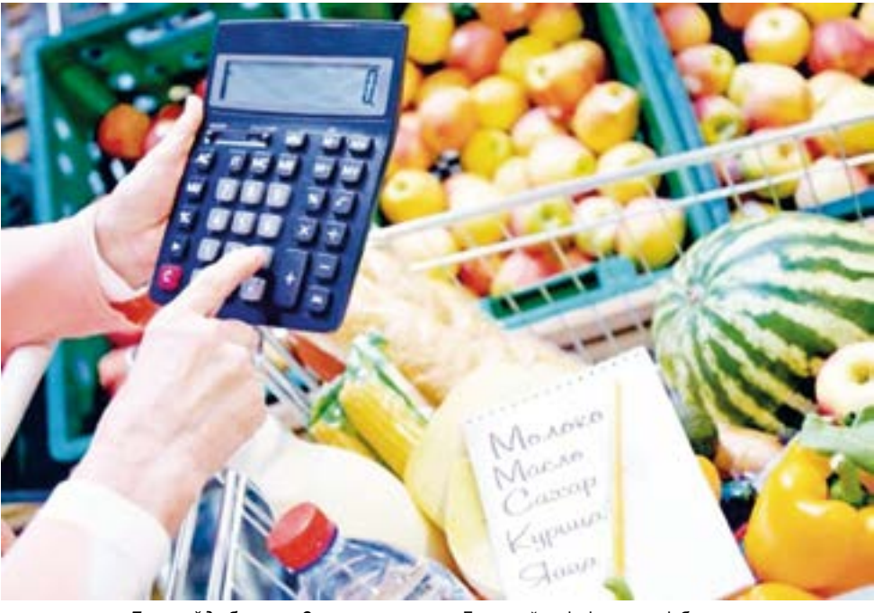
Баға қайда барасың? Айға самғап ұшасың! Ұшар көлігің Зымыран, Жеткізбей зулап барасың!!!