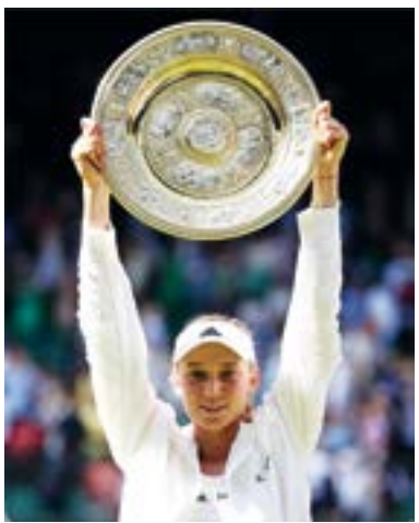
дому поколению развиваться, - сказала Елена Рыбакина.

Казахстанская теннисистка Елена Рыбакина стала чемпионом Открытого чемпионата Великобритании - Уимблдонского турнира. В финале первая ракетка Казахстана встретилась с представительницей Туниса Онс Жабер и обыграла её в трех сетах с общим счетом 3:6, 6:2, 6:2.