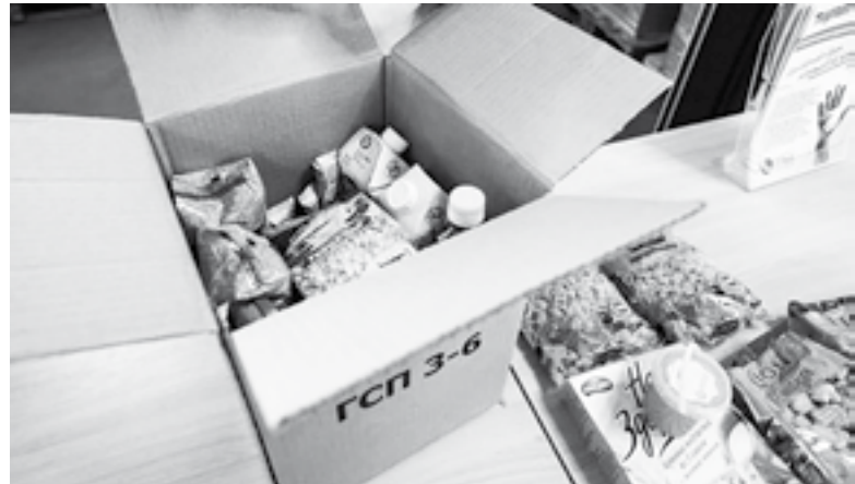
«Қарабұлақ ауылдық округі әкімінің аппараты» ММ-сі

6 жастан 18 жасқа дейінгі балалар, оқу жылы басталар алдында мектеп формасы мен керек-жарақтары, оқу кезінде ыстық тамақ қамтамасыз етілетін оқушылар.