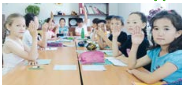
Ескелді ауданы бойынша білім бөлімі

26 мамыр күні аудан бойынша барлық мектептерде жазғы мектеп жұмысы басталды. Білім алушылардың оқу пәндері бойынша біліміндегі олқылықтардың орнын толықтыруға деген қажеттіліктерін ескере отырып, сараланған тапсырмалар әзірленді. Жазғы мектепте мектеп кітапханасына, цифрлық білім беру ресурстарына қолжетімділік қамтамасыз етілді. Осы бағыттағы білім беру жұмыстары 17 маусымға дейін жүргізіледі.