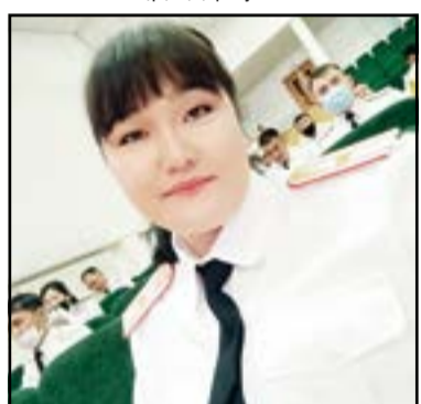
Нәзік иықтарымен ауыр салмақты арқалаған нем аудан жұртының тыныш ұйқысы мен қауіпсіздігін қамтамасыз етудің ауыр жүгін арқалап жүрген батыл жеректі қарлығыш, аудандық полиция

Бүгінгі арулардың бойындағы сол тәрбие, сол тәлім, қанмен сіңген сол – дара қасиет өз жемісін үнемі көрсетіп келеді. Қырық шырақты арудың бойында қырық қасиет бар. Бірі – ұстаз, бірі – дәрігер, бірі – кәсіпкер, бірі – полиция қызметкері, бірі – такси жүргізушісі, бірі – айшылық алыс жерлерден келген бума-бума хатты үйді-үйге сабыла таситын пошташы. Иә бұл мамандықтарды бекер тілге тиек еткенім жоқ, бүгінгі өңімем батпаны биік шаруаны атқарып жүрген аудандағы нәзік жандылар жайлы болмақ. Әйелдер қоғамның бар саласында еңбек етеді. Десек те ерлердің өзіне ауыр тиетін салалар аз емес. Оның бірі ер-азаматқа енші болған – құқық қорғау саласы.