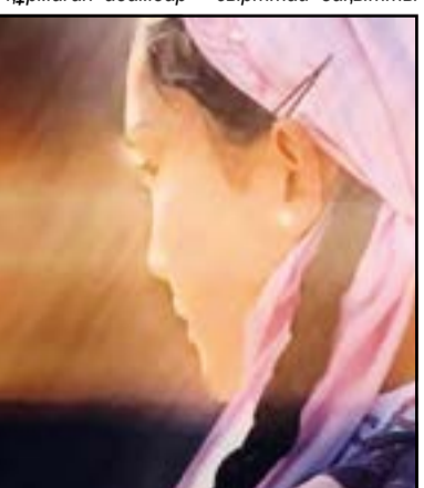
болып көрінгенімен жан күйзелісіне ұшырағандар. Табиғат заңы бойынша еркек те, әйел де жалғыз болмауы тиіс. Оны тұтастық дейді. Ал материалдық жағдайға байланысты отбасын құрмау ол ойы жетілген адамның қылығы. Ақыл тоқтатқан адам ғана ертең қаржы жетпесе қиналамыз деп ойлайды. 25-30 жаста психологиялық толысудан кейін тұрмысқа шығу өте қиын. Бұрынғы «үйленіп алсақ, бәрін бірге көреміз» деген стереотип 20-жастағы қыздың ойында ғана бар. 0 жаста ол мүмкін еместей

болу, балалы болу сынды жауапты іске мойынсұну қиын. Бойдақ жүрген адам өзін еркін сезінеді, балам жылады, кешкі ас, уй шаруасы, жуылмаған кесе, балабақша деп асықпайды. Шын мәнісінде бұл уақытша құбылыс. Жалпы 30-дан асып, отбасы құрмаған адамдар – сырттай бақытты