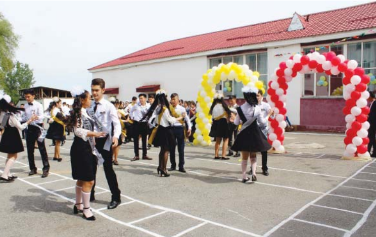
25 мамыр күні Жетісу орта мектебінің 2018-2019 жылғы түлектері балдәурен балалық шақпен қоштасып, болашаққа,

Өткен аптаның сенбісінде республиканың барлық мектептерінде балалық шақтың «қош» деген үніндей болған соңғы қоңырау сыңғыр қақты. Күні кеше ғана қара көзі мөлдіреген балақан мен тұлымшағы желбіреген қыз енді мектеп партасымен мәңгілік қоштасып, үлкен өмірге қанат қақты.